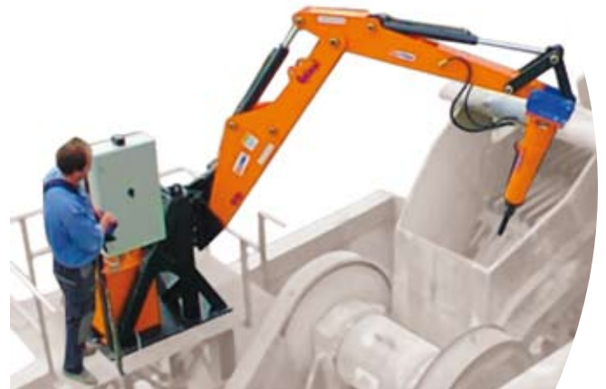
BA5 BA4-18 UR